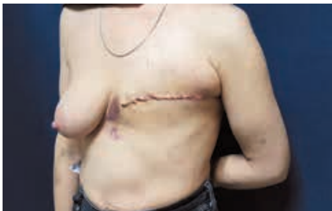
Рис. 3. Вид пациентки, 6-е сутки после операции радикальной мастэктомии слева