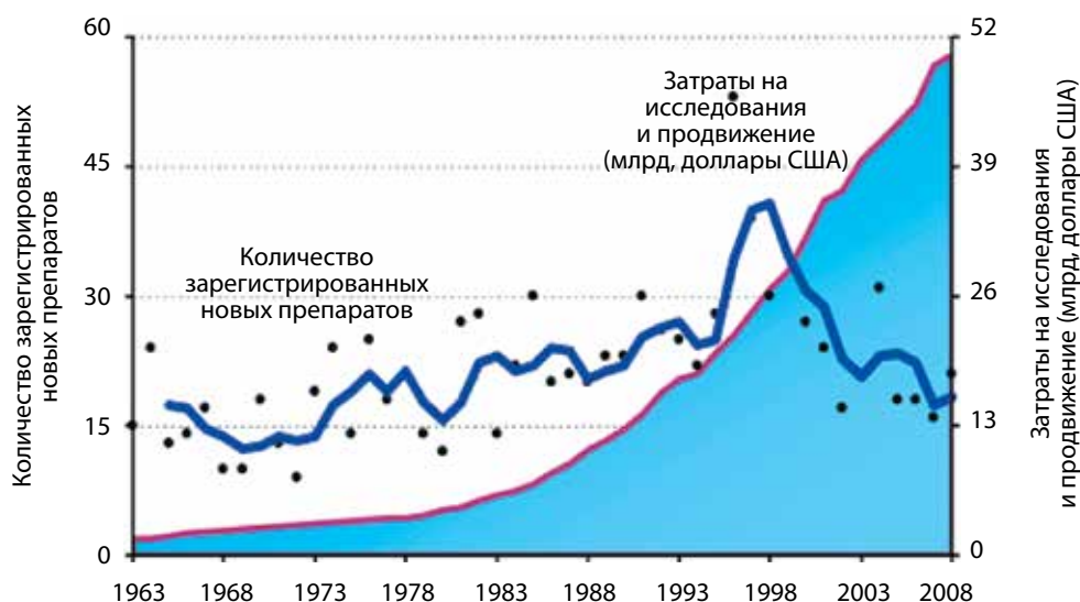
Рис. 3. Ежегодное количество регистрируемых новых препаратов (синяя линия) против расходов на научные исследования (голубая область)

ного фотосенсибилизатора, разработанного РУП «Белмедпрепараты» и зарегистрированного в Республике Беларусь в 2001 г. В период длительного сотрудничества с производителем препарата последний был испытан на базе РНПЦ ОМР им. Н.Н. Александрова при раке и предраке шейки матки, базалиоме, меланоме кожи, раке мочевого пузыря, полости рта, меланоме сетчатой оболочки глаза, перитонеальном канцероматозе и сепсисе, при этом была показана клиническая эффективность препарата. Тем не менее широкие клинические испытания, которые позволили бы внести метод в стандарты лечения ЗНО или зарегистрировать препарат в Евросоюзе так и не были проведены.